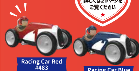
Racing Car Red #483