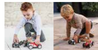
Racing Car Red #483

子ども用ベダルカーの製造・販売をしているフランスのBaghera社の正規日本代理店のネットショップ。この商品は手に持って遊ぶタイプのキッズカーです。サイズ:L18×W9×H10cm(2種とも)