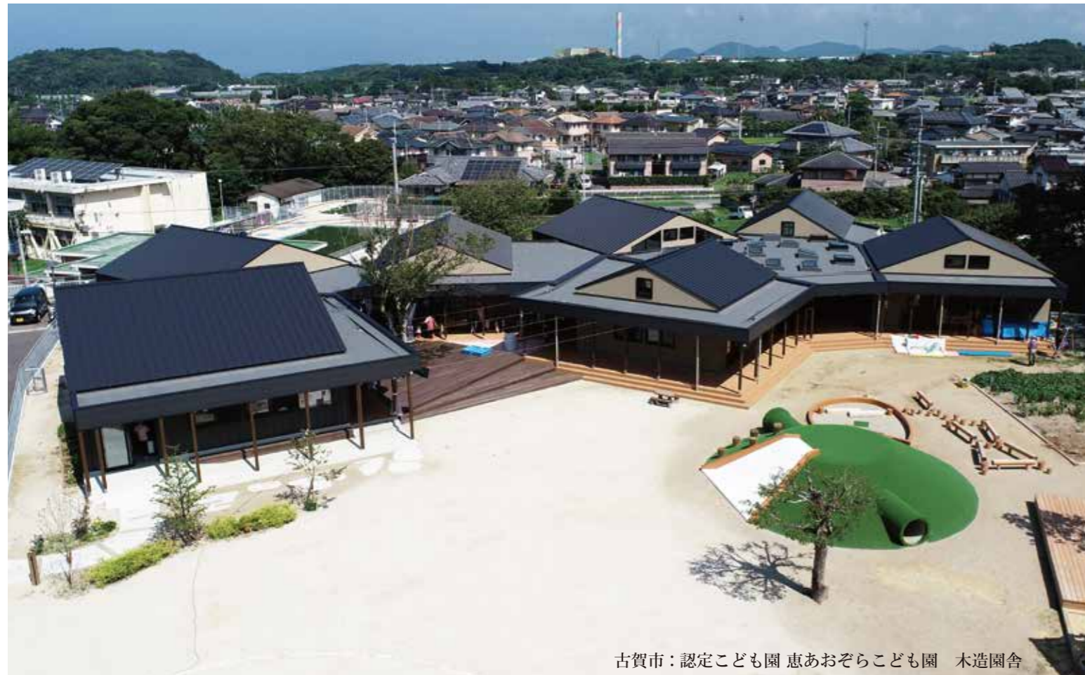
古賀市：認定こども園 恵あおぞらこども園 木造園舎