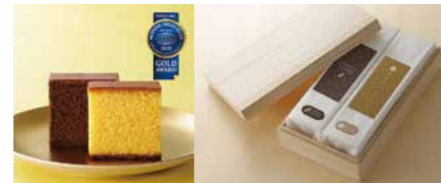
※2商品ともに0.65号・380g(10切)×1

モンドセレクション2020国際金賞・3年連続金賞W受賞の五三焼カステラとプレミアム・ショコラをセットでプレゼント。材料・製法にこだわり、極上のカステラを目指して、熟練の職人が1枚1枚丁寧に焼き上げます。